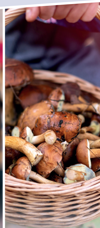
NATUR & SANKETURE